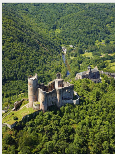
Attribution : La Forteresse Royale de Najac (Crédit: Aveyron tourisme)